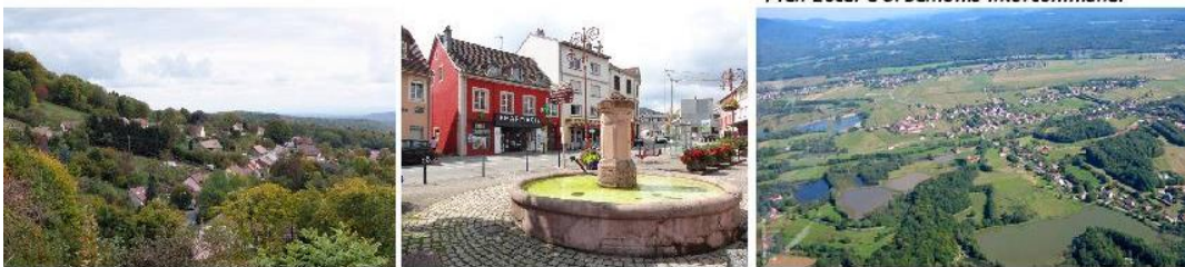
*Plan Local d'Urbanisme intercommunal

Depuis les réunions publiques qui se sont tenues à l'automne 2019, la CCVS et les communes travaillent à la traduction réglementaire des orientations fixées dans le Projet d'Aménagement et de Développement Durables (PADD) du PLUi. Suites aux élections municipales de mars 2020, et malgré un contexte sanitaire peu propice aux réunions de travail, les élus se sont mobilisés pour définir les règles des zones urbaines, agricoles, naturelles et forestières. Lors d'un comité de pilotage, qui s'est déroulé en présentiel en juin 2020, il a été convenu que les élus travailleraient ensemble la rédaction du règlement écrit ( le zonage constitue le règlement graphique ).